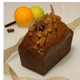
le Voyageur Miel-Épices