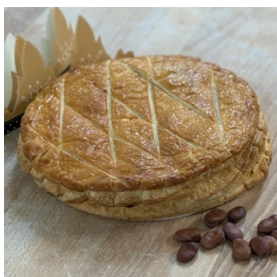
la Galette des Rois